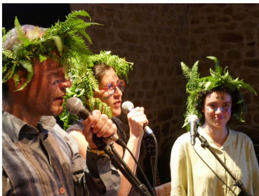
Juillet 2024 - BAL - Grand bal de l'Europe, sur le parquet découverte - Gennetines (03)